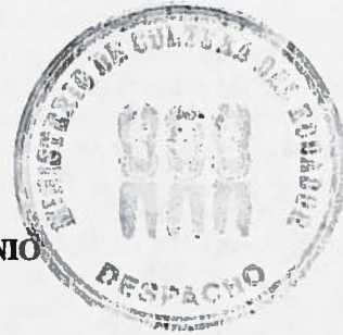
Francisco Velasco Andrade MINISTRO DE CULTURA Y PATRIMONIO

Dado en el Distrito Metropolitano de Quito, a 27 JUN 2013